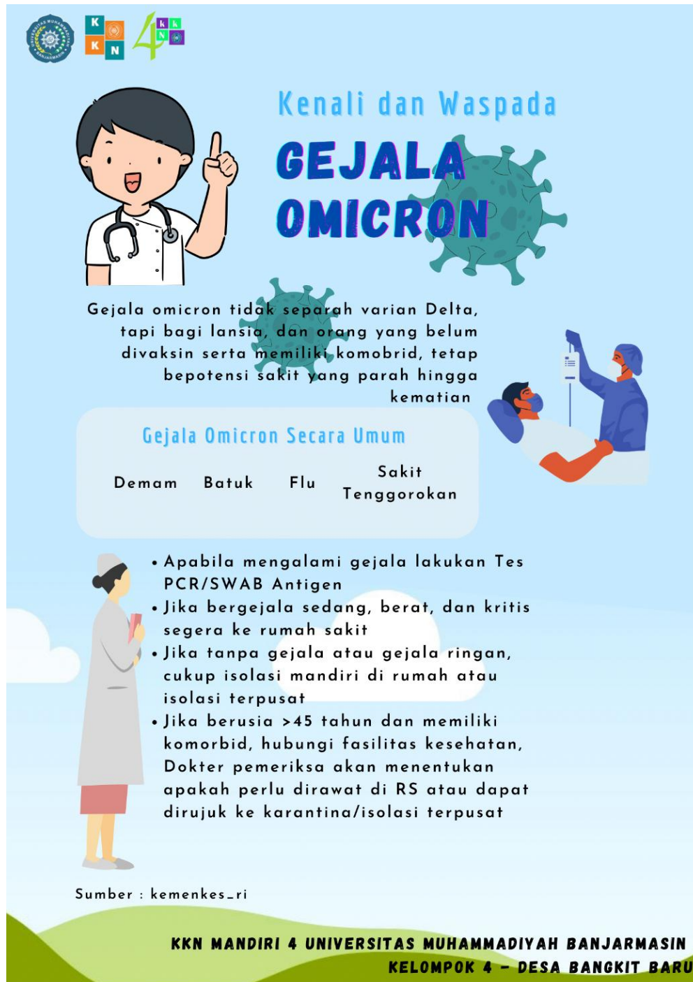
Gambar 1. Poster Mengenali dan Waspada Gejala Omicron

Pelaksanaan kegiatan Penempelan Poster tentang Mengenali dan Waspada Gejala Omicron ini dilaksanakan pada Senin, 21 Febuari 2022 di beberapa titik seperti sekolah. Penempelan Poster ini diharapkan menjadikan pengetahuan dan informasi mengenai gejala Omicron untuk warga Desa Bangkit Baru.