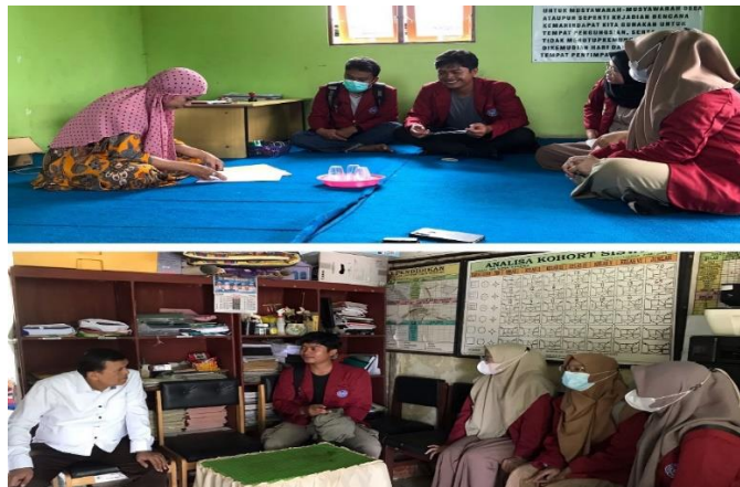
Gambar 1. Wawancara bersama sekretaris kantor desa dan kepala sekolah SDN Desa Sungai Ramania

Dalam rangka kegiatan Kuliah Kerja Nyata (KKN) yang dilaksanakan di Desa Sungai Ramania khususnya di sekolah, kantor desa dan beberapa titik desa. Sebelum melakukan pembagian dan pemasangan pamflet, mahasiswa meminta izin dan melakukan wawancara terlebih dahulu dengan beberapa perangkat desa yaitu sekretaris kantor desa, guru dan masyarakat sekitar.