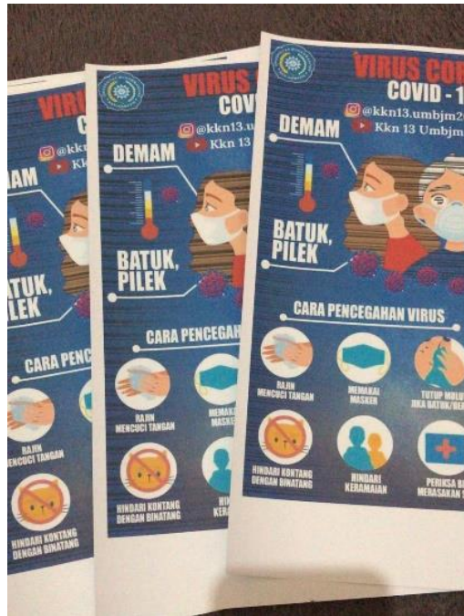
Gambar 3. Hasil cetak pamflet

Pembagian dan pemasangan pamflet dilakukan pada minggu ke dua KKN pada hari Selasa-Rabu pukul 09.00 WITA di SDN Sungai Ramania, Kantor Desa dan Warung-warung.