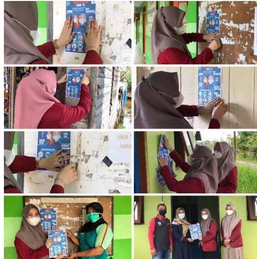
Gambar 5. Proses pemasangan pamphlet